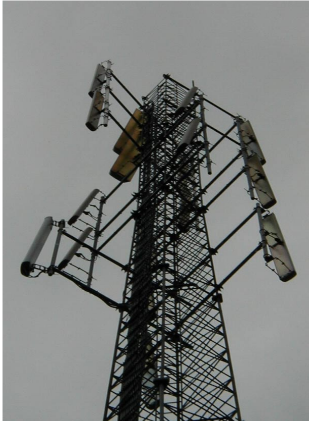
Eksempel på mastemontert antenner