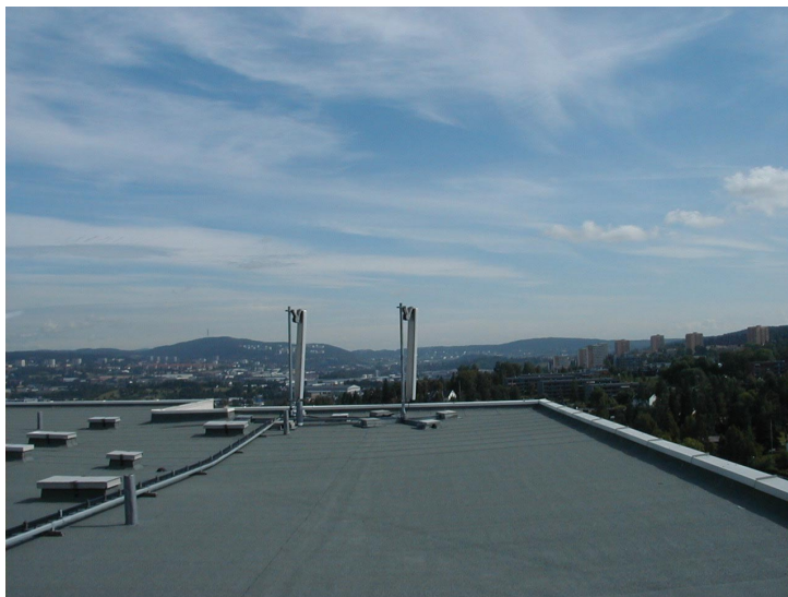
Eksempel på takmonterte antenner.

Ved antenner montert på tak ble det foretatt målinger ute på tak foran og bak antennene der det var tilgang. Det ble også foretatt målinger i lokaler rett under antennene og på veranda i etasjen under der det var fri sikt til antennene. I alt ble det målt ved 9 slike anlegg. Målingene under antennene er foretatt i 2 meters høyde over gulvet. Resultatene er vist i tabell 3.