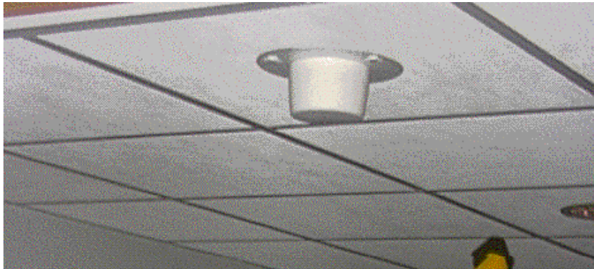
Innendørsantenne montert i tak.

I enkelte kontorlokaler er det montert små antenner innvendig i taket som sender med effekt typisk i mW-området for å gi en bedre mobiltelefondekning inne i bygget. I hodehøyde rett under antennen var feltstyrkenivået 1-2 V/m mens det i lokalet ellers var 0,2-0,4 V/m.